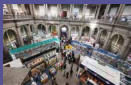
FIL Minería Del 22 de febrero al 5 de marzo