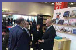
FIL de la Universidad Autónoma de Sinaloa Del 9 al 15 de marzo