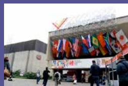
Feria del Libro de Bolonia, Italia Del 26 al 29 de marzo