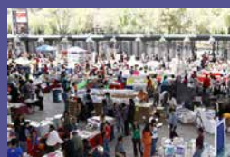
Gran Remate de Libros del Auditorio Nacional Del 23 de marzo al 3 de abril