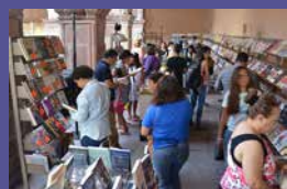
Feria del Libro de Celaya Del 16 al 25 de marzo